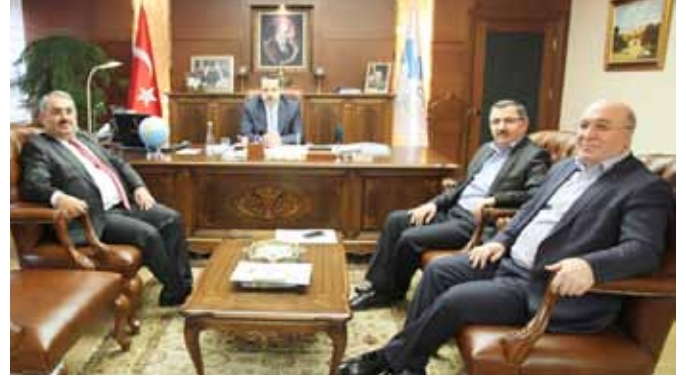
Bakan Faruk Çelik ile Görüşme

Görüşme sonucunda Başbakan Erdoğan, kendisine aktarılan konularla ilgili olarak Çalışma ve Sosyal Güvenlik Bakanı Faruk Çelik'le birlikte çalışılması ve bu çalışmanın sonuçlarının paylaşılması yönünde görüş beyan etti.